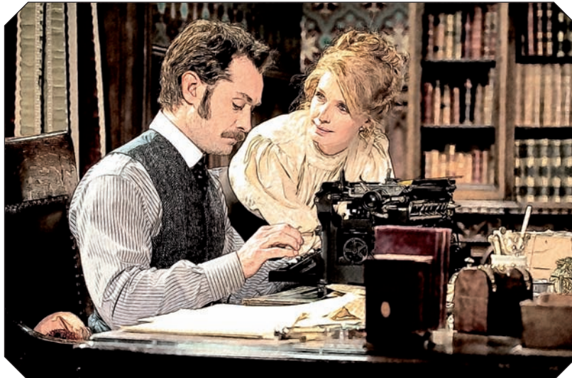
Au début du film, alors que Watson tape à la machine à écrire, on aperçoit des pages des comptes rendus de The Blue Carbuncle et de A Study in Scarlet .

DÉCORATIONS AFGHANES - Le soir de son enterrement de vie de garçon, Watson porte sur sa veste d'uniforme l' Afghan War Medal (ruban rouge et vert) et la Kandahar Bronze Star (ruban à rayures multicolores), médailles des vétérans de la Seconde guerre afghane (1878-1880).